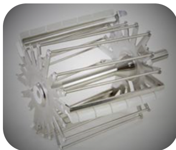
FOUET Pour le refroidissement et l'émulsion des pâtes à bombes, crèmes au beurre, mousselines ...