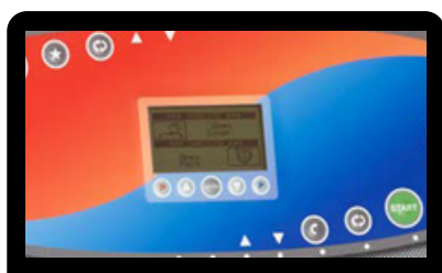
PETIT ÉCRAN DE SÉRIE Avec tous les programmes affichés et les températures en monochrome contrôle Touch