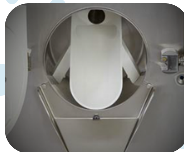
GOULOTTE D'EXTRACTION À CHAUD Pour les pâtes de fruits, confitures, ganaches, flans ...