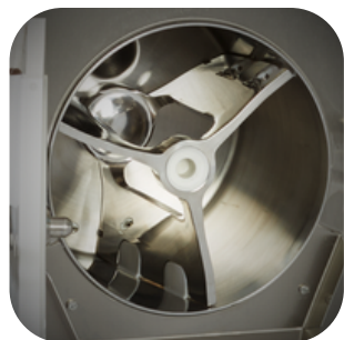
AGITATEUR AVEC DENTS INTERCHANGEABLES Pour le turbinage des glaces, refroidissement des crèmes, bavaoises